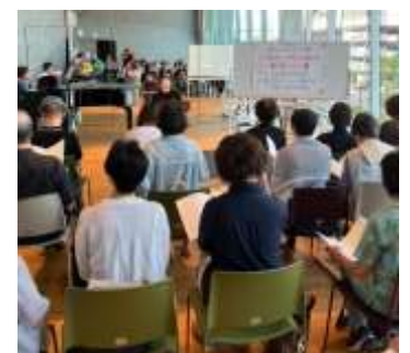
しあわせ・群青 西神地域