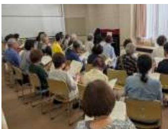
シニア合同 東播地域