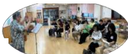
もう一人行進曲練習 保育士さんと共に 上太田共同保育所・下杉の子保育園